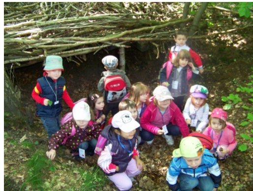
Dans l'abri des sangliers