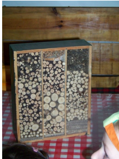
Un abri à insectes